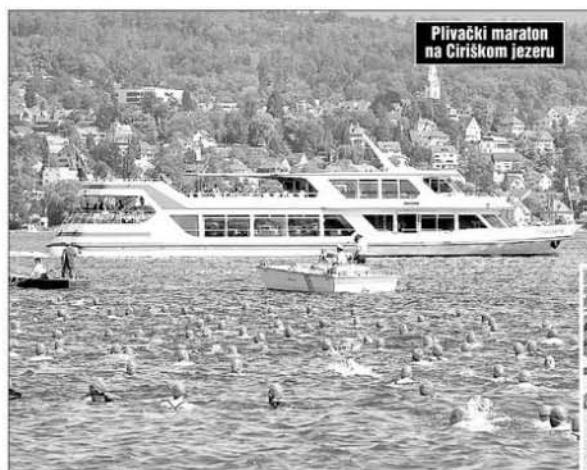
Plivački maraton na Ciriškom jezeru

Na 23. ciriškom maratону u plivanju našlo se 7.334 osoba, čime je ostvaren rekord po broju učesnika. Dan je bio izvanredan, a plivači su prešli stazu od 1.450 metara.